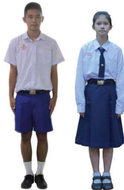
เครื่องแต่งกายนักเรียนชาย-หญิง ชั้นมัธยมศึกษาปีที่ 4 - 6

1.6 ทรงผม ทรงนักเรียน ทรงอเมริกัน หรือรองทรง (ตีนผมด้านข้างและด้านหลังต้องตัดให้ติดหนังศีรษะ ห้ามไว้จอนหรือปล่อยตีนผมแบบบรากไทโร ส่วนยาวของผม ด้านหน้าต้องไม่ยาวเกินระดับคิ้วลงมา) และห้ามใส่น้ำมันหรือเครื่องสำอางใดๆ