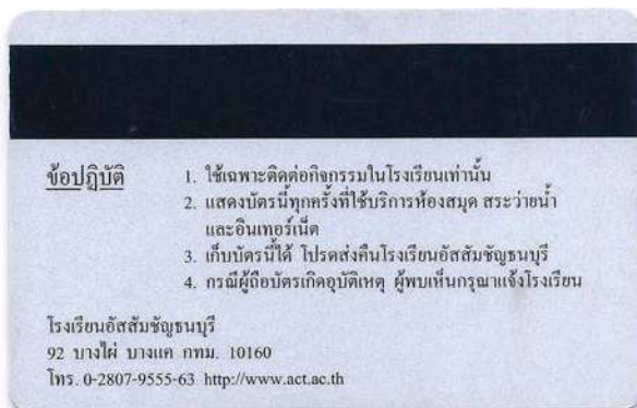
ตัวอย่างบัตรด้านหลัง