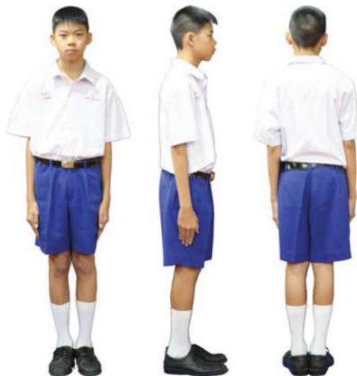
เครื่องแต่งกายนักเรียนชาย ชั้นมัธยมศึกษาปีที่ 1 - 3

ขนาดตัวอักษร 0.5 นิ้ว และเลขประจำตัว ขนาด 1 เซนติเมตร ด้วยไหมสีแดง ที่ปลายปกเสื้อด้านขวา ปักดาวด้วยไหมสีน้ำเงิน ชั้นมัธยมศึกษาปีที่ 4 ปักดาว 1 ดวง ชั้นมัธยมศึกษาปีที่ 5 ปักดาว 2 ดวง และชั้นมัธยมศึกษาปีที่ 6 ปักดาว 3 ดวง มีเนคไทสีกรมท่า สีเดียวกับกระโปรง ปลายตัดตามแบบของโรงเรียน ผูกพอดีคอเสื้อและติดเข็ม วิทยฐานะให้ตรงกับกระดุมเสื้อเม็ด ที่ 3 เมื่อผูกเนคไท ให้ความยาวเสมอ ขอบเข็มขัดด้านบน เวลาสวมให้นำชาย เสื้อไว้ในกระโปรง และใส่เสื้อทับเต็มตัว ทุกครั้ง