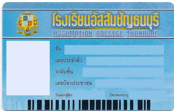
ตัวอย่างบัตรด้านหน้า

เวลา 07.10 - 16.00 น. เวลา 07.30 - 15.30 น.