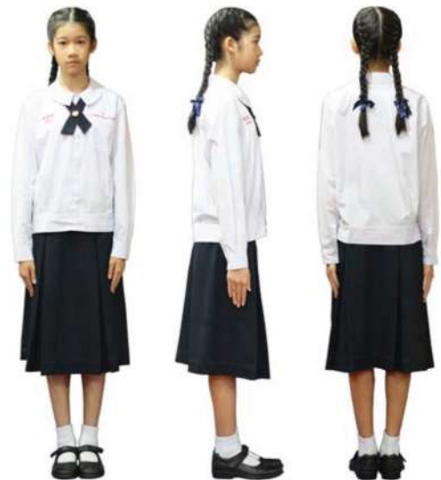
เครื่องแต่งกายนักเรียนหญิง ชั้นมัธยมศึกษาปีที่ 1 - 3